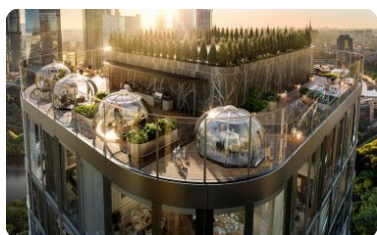
Lounge-зоны на крышах