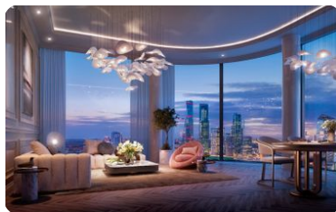
Панорамное и радиусное остекление