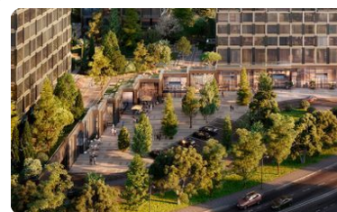
Собственная инфраструктура комплекса

Жилой комплекс состоит из 5 башен высотой в 45 и 46 этажей. Автором архитектурного проекта выступает одно из самых именитых отечественных бюро — ADM. Архитектура отличается уникальной пластикой фасадов с использованием панорамного остекления. У башен есть свои имена: Topaz, Emerald, Amber, Diamond и Lazur. В лобби выполнена премиальная отделка и предусмотрен консьерж сервис.