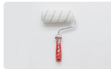
Квартиры без отделки, с отделкой White box и с отделкой под ключ