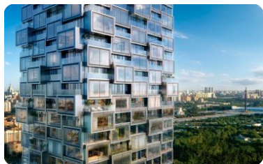
Проект архитектурного бюро ADM